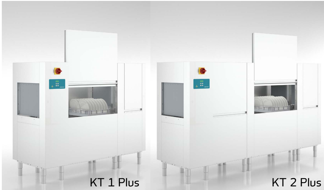
KT 1 Plus